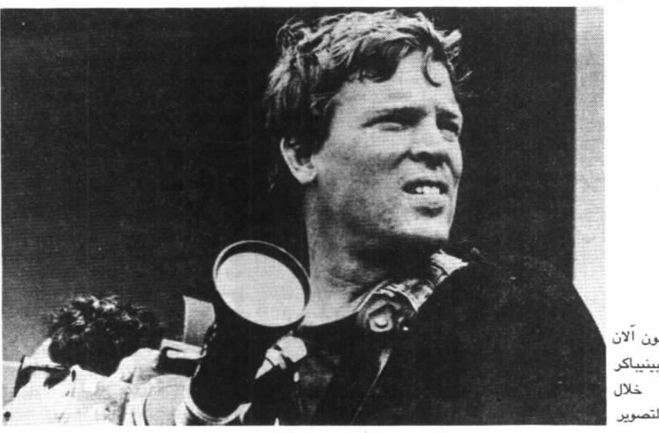
دون آلان بينيكر خلال التصوير